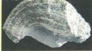
特別天然記念物 北投石(ほくとうせき)

足温浴®「あったかさん」は“湯の花”から有害物質を特殊技術で取り除き、有効な温泉成分を残した状態に加工した人工北投石(湯の花プレート陶板)を敷いた本物の足温浴です。