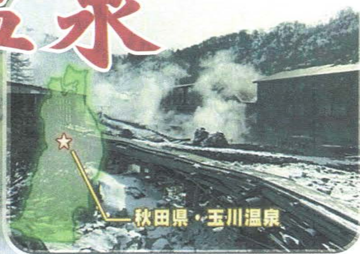
秋田県・玉川温泉

秋田県仙北市田沢湖の山間にあり 源泉は 98℃、Ph1.2 の塩酸性強酸泉。 湧出量は毎分 9000ℓ で1ヶ所からの 湧出量は日本一。 岩盤浴発祥の地としても有名です。